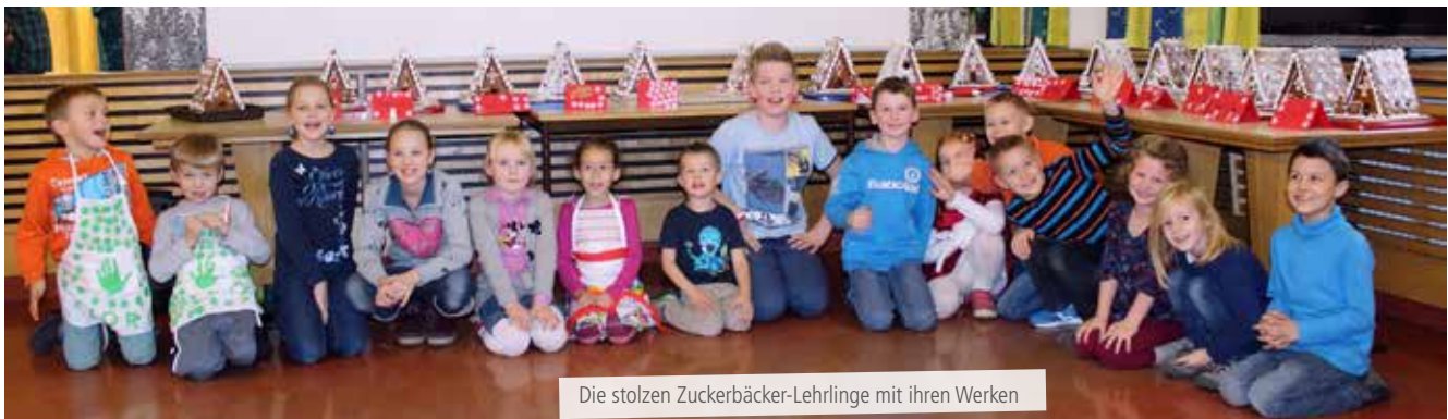
Die stolzen Zuckerbäcker-Lehrlinge mit ihren Werken