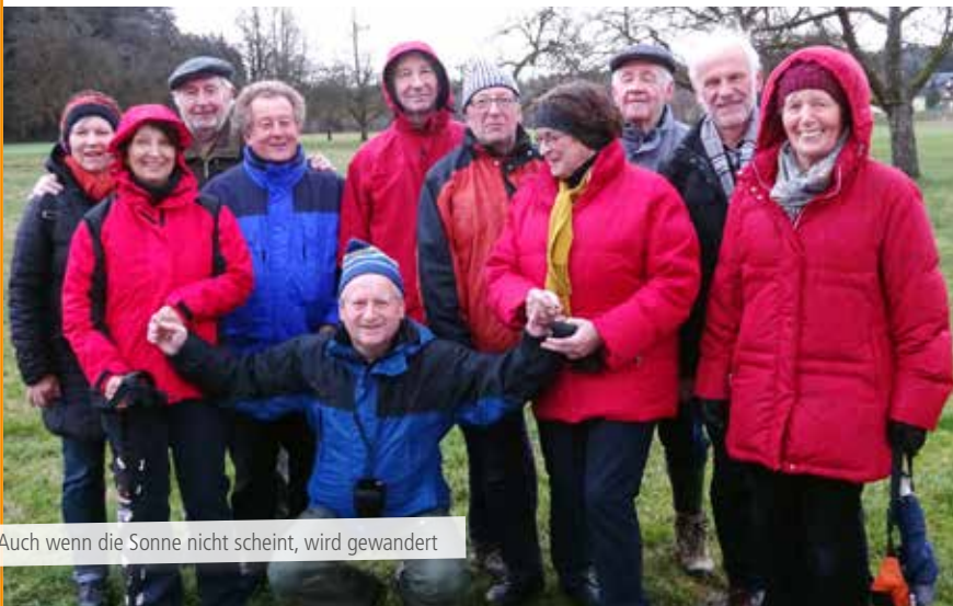
Auch wenn die Sonne nicht scheint, wird gewandert

47 Mal wurde gewandert, nur 3 Mal musste wegen Regens abgesagt werden. Insgesamt haben 633 Wanderfreudige teilgenommen, 27 davon kamen nur zum geselligen Zusammensein im Gasthaus. In insgesamt 113 Gehstunden wurden etwa 450 km bewältigt. Die kleinste Gruppe bestand aus 6, die größte aus 19 Teilnehmern.