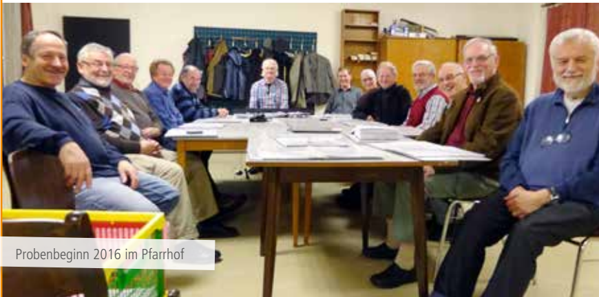
Probenbeginn 2016 im Pfarrhof