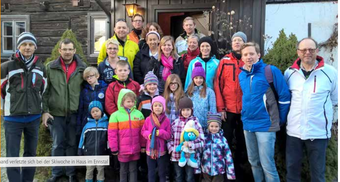
Niemand verletzte sich bei der Skiwoche in Haus im Ennstal